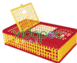
JTPV0109017 Jaula para transporte de pollo vivo