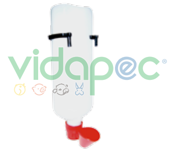
BPGX0204001 Bebedero para gallo de 1.250 lts. con abrazadera.