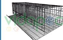
JPGP0901001 Jaula para Gallina de Postura 1.50 mts 5N.