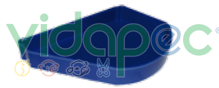
TCCI0203001 Tapon Canal Comedero Izquierdo.