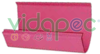
CCGP0203001 Canal Comedero de PVC para gallina de postura.