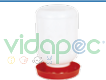
BVXX0104001 Bebedero vitrolero de 4 lt.