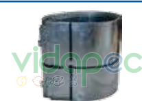
RDLX0204001 Redondel de lámina