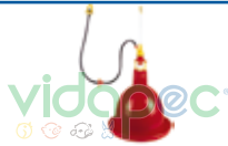
AAAX0104001 Abastecedor de agua para aves