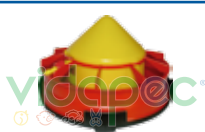
BAIP0104003 Bebedero Automatico de Iniciacion en Piso con base y rejilla