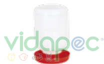
BVXX0104001 Bebedero Vitrolero de 1/2, 1 y 2 lts.