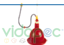
AAAX0109002 Abastecedor de agua para aves.