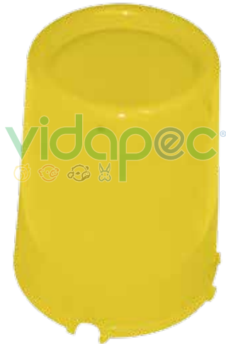
CT3K0103002 Tolva para comedero de 3 Kg.