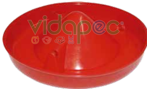
CT3K0103001 Plato para comedero de tolva de 3 Kg.