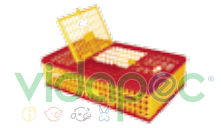
JTPV0104001 Jaula para transporte de pollo vivo.