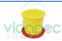
CTPX0104001 Comedero Plus de 6 kgs.