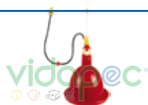
AAAX0109002 Abastecedor de agua para aves.