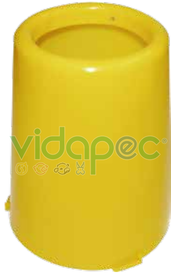
CT1K0103003 Base cónica para comedero de tolva de 1 Kg.