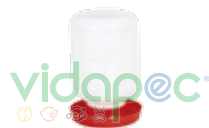
BVXX0104001 Bebedero Vitrolero de 1/2, 1 y 2 lts.