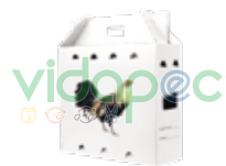
CPGX0204001 Caja para gallo blanca