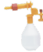
BAIP0109002 Flotador completo para bebedero automatico de iniciación en piso con empaque.