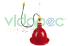
AAAX0109002 Abastecedor de agua para aves.