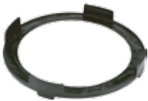
BAIP0103008 Base para BAIP.