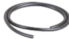
MTLX0104001 Manguera P.V.C. de 1/4" (mt)