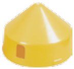
BAIP0103002 Tapa para BAIP.