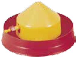
BAIP0109001 Bebedero automático de iniciación en piso